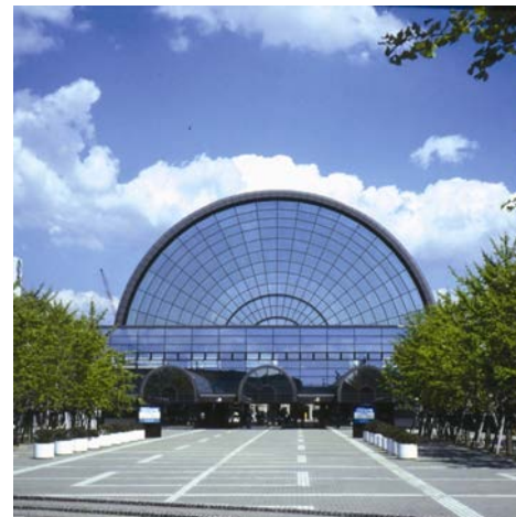
【ケアテックス関西2019会場図】

なお、ケアテックスへの入場には招待券が必要となります。招待券をご希望される介護事業従事者の方は、弊社までお気軽にお問い合わせください。